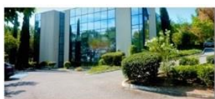
WORKING ROLLS - centre d'affaires AIX Gare TGV

Le bureau situé au 38 Parc du Golf est ouvert de 9 H à 19 H, du lundi au vendredi.