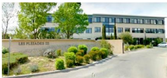
WORKING ROLLS - Centre d'affaires AIX DURANNE

Le bureau situé au 320, rue d'Archimède, à Aux-La-Durance, est accessible aux personnes à mobilité réduite, aux mêmes horaires d'ouverture.